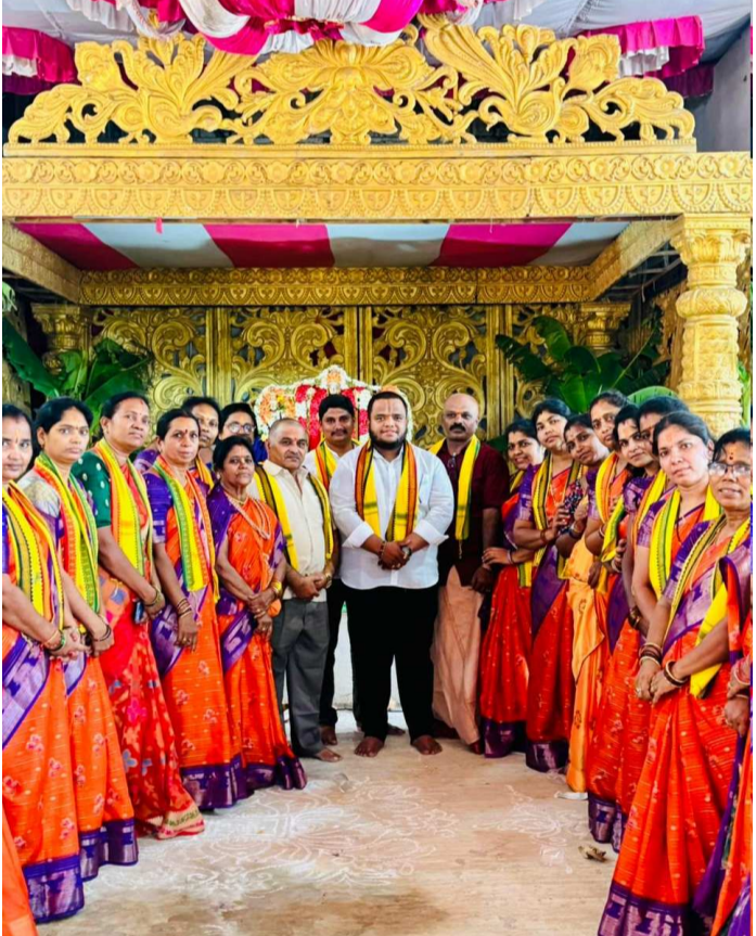
రాజంపేట (ప్రజా సీమ) : శ్రీవారి భక్త సేవ సమితి ఆధ్వర్యంలో వైశాఖ పౌర్ణమి సందర్భంగా రాజంపేట మండలం రామ్ నగర్ లోని