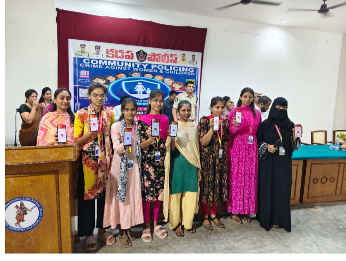
vivo V60 | 23mm f/1.88 1/100s ISO414 05/01/2026, 11:56