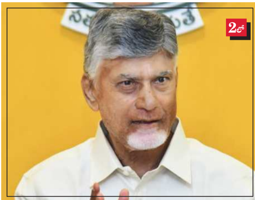
ఆపరేషన్ సిందూర్ ప్రపంచానికి స్పష్టమైన సందేశం పంపిందని ఆయన అన్నారు. గురువారం (మే 7) ఆపరేషన్ సిందూర్ తొలి వార్షికోత్సవం సందర్భంగా 'ఎక్స్' వేదికగా చంద్రబాబు

ఆంధ్రప్రదేశ్, మే 7 : ఆపరేషన్ సిందూర్ కు ఏడాది పూర్తయిన సందర్భంగా ఆంధ్రప్రదేశ్ ముఖ్యమంత్రి చంద్రబాబు కీలక వ్యాఖ్యలు చేశారు. మన గడ్డపై దాడులను దేశం సహించబోదని, మన పౌరులకు ఎలాంటి హాని జరిగినా చూస్తూ ఊరకోబోమని