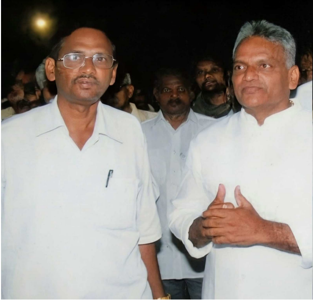
కాగలదని లకనం నాగాంజనేయులు ఆశాభావం వ్యక్తం చేశారు.

- పరామర్శించిన జిల్లా కలెక్టర్ మరియు ఉన్నతాధికారులు