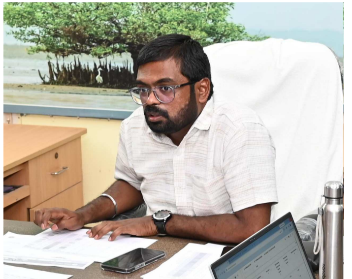
ఎలాంటి అత్యవసర పరిస్థితులు తలెత్తినా వెంటనే స్పందించేలా వైద్య సిబ్బంది సిద్ధంగా ఉండాలని చెప్పారు. పాఠశాలలు, అంగన్వాడీ కేంద్రాల్లో పిల్లల ఆరోగ్యంపై ప్రత్యేక దృష్టి పెట్టాలని, తాగునీటి సౌకర్యాలు పరిశీలించాలని సూచించారు. పశుసంవర్ధక శాఖ అధికారులు పశువులకు తాగునీరు, నీడ ఏర్పాట్లు చేయాలని తెలిపారు. ప్రతి మండలంలో కంట్రోల్ రూములు ఏర్పాటు చేసి పరిస్థితిని నిరంతరం పర్యవేక్షించాలని కలెక్టర్ ఆదేశించారు. వడగాలులపై ప్రభుత్వం జారీ చేసిన మార్గదర్శకాలను కచ్చితంగా అమలు చేయాలని పేర్కొన్నారు. ఈ టెలి కాన్ఫరెన్స్లో వివిధ ప్రభుత్వ శాఖల జిల్లా అధికారులు, ఆర్డీవోలు, పోలీస్ అధికారులు, మున్సిపల్ కమిషనర్లు, నియోజకవర్గాలు, మండల ప్రత్యేక అధికారులు, మండల స్థాయి అధికారులు పాల్గొన్నారు.

మచిలీపట్నం, (ప్రజా సీమ): జిల్లాలో రోజురోజుకు ఉష్ణోగ్రతలు పెరుగుతున్నచో నేపథ్యంలో వడగాలుల ప్రభావంపై అన్ని శాఖల జిల్లా, మండల స్థాయి అధికారులు అప్రమత్తంగా ఉండాలని జిల్లా కలెక్టర్ డి.కే. బాలాజీ అధికారులను ఆదేశించారు. బుధవారం కలెక్టర్ వివిధ శాఖల అధికారులతో టెలి కాన్ఫరెన్స్ నిర్వహించి వడగాలుల నివారణ చర్యలపై సమీక్షించారు. ఈ సందర్భంగా కలెక్టర్ మాట్లాడుతూ, ప్రజలకు ఎలాంటి ఇబ్బందులు కలగకుండా ముందస్తు జాగ్రత్త చర్యలు చేపట్టాలని సూచించారు. గ్రామాలు, పట్టణాల్లో ముఖ్యమైన కూడలిలో, ప్రదేశాలలో చలివేంద్రాలు ఏర్పాటు చేసి ప్రజలకు తాగునీటి సౌకర్యం కల్పించాలని అధికారులను ఆదేశించారు. ప్రజలకు వడదెబ్బ లక్షణాలు, తీసుకోవాల్సిన జాగ్రత్తలపై విస్తృత ప్రచారం నిర్వహించాలని తెలిపారు. మధ్యాహ్నం 12 గంటల నుంచి 3 గంటల వరకు అత్యవసరం అయితే తప్ప ప్రజలు బయటకు రావద్దని సూచనలు ఇవ్వాలని తెలిపారు. తప్పనిసరి పరిస్థితులలో బయటికి వస్తే తెల్లని వస్త్రాలు తేలికపాటి నూలు వస్త్రాలు, తలకు టోపీ గాని తడి చేసినా రుమాలు ధరించాలని ప్రజలకు అవగాహన కలిగించాలన్నారు. దప్పిక ఉన్న లేకున్నా తరచూ మంచినీరు మజ్జిగ ఓఆర్ఎస్ చెరుకు రసం నిమ్మరసం వంటివి తాగి తేమశాతం ఉండేలా ప్రజలకు తెలియజేయాలన్నారు. ఉపాధి హామీ పనులు, నిర్మాణ పనులు తదితర బహిరంగ పనుల్లో పాల్గొనే కార్మికులకు తాగునీరు, ఓఆర్ఎస్ ప్యాకెట్లు, నీడ సదుపాయాలు కల్పించాలని సూచించారు. ముఖ్యంగా పిల్లలు వృద్ధులు గర్భిణీ స్త్రీలు అనారోగ్యంతో ఉన్నవారు ఎండలో తిరగకుండా జాగ్రత్త వహించాలని ప్రజలకు తెలియపరచాలన్నారు వైద్య ఆరోగ్య శాఖ అధికారులు ప్రాథమిక ఆరోగ్య కేంద్రాలు, ప్రభుత్వ ఆసుపత్రుల్లో అవసరమైన మందులు, ఐపీ ఘ్నాయిడ్స్, ఓఆర్ఎస్ ప్యాకెట్లు అందుబాటులో ఉంచాలని ఆదేశించారు.