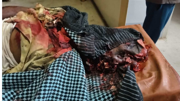
రాజంపేట (ప్రజా సీమ): తిరువతి జిల్లా పుల్లంపేట బ్రిడ్జిపై