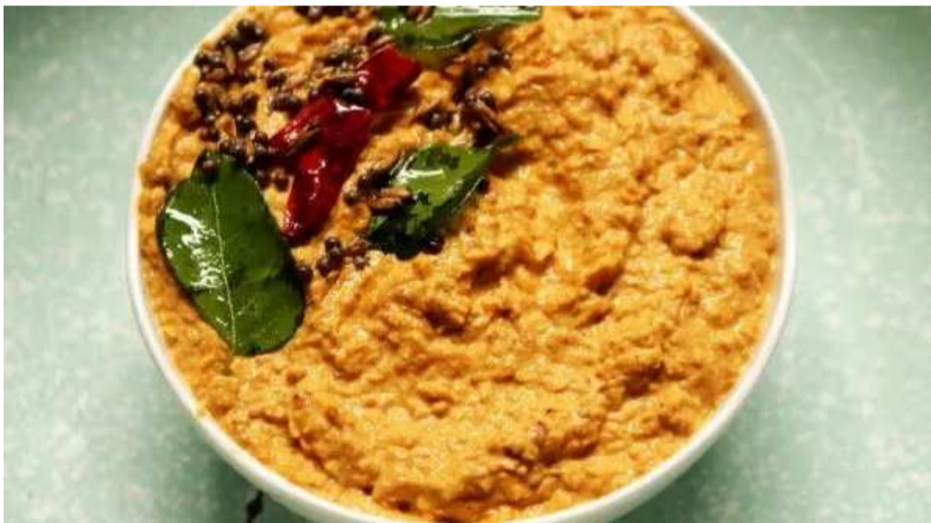
అవసరమైతే కొద్దిగా నీరు కూడా కలుపుకోవచ్చు. ఇప్పుడు ఒక చిన్న పాన్ లో నూనె వేసి ఆవాలు