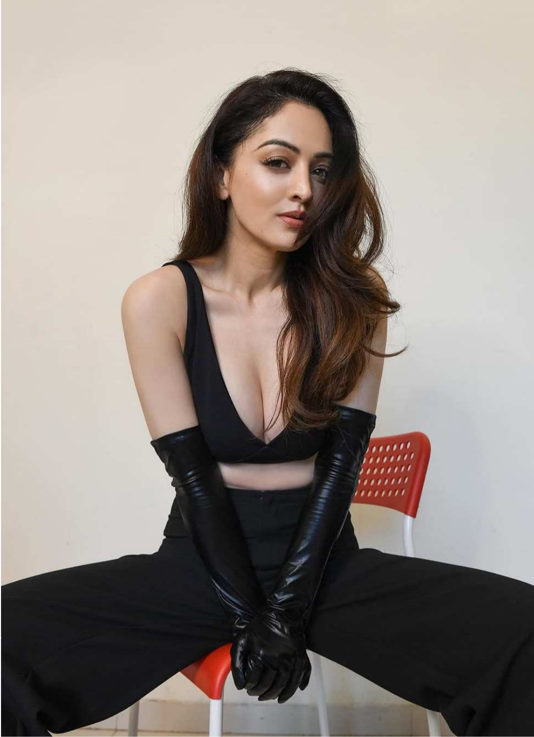
అందాల 'జాన్సీ'.. తెలుగులో సరైన ఛాన్స్ పడితే..